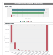
▲償還改定試算画面イメージ